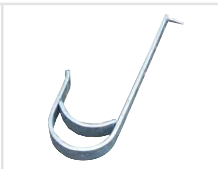
Tetőkampó palához (a DIN EN 517 szerint)

Cikkszám (natúr) 804518 Cikkszám (vörös) 804716 Cikkszám (barna) 804778 Cikkszám (antracit) 804839