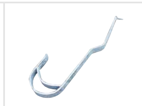
Tetőkampó sík és hullámos tetőcserepekhez (a DIN EN 517 szerint)

Cikkszám (natúr) 804518 Cikkszám (vörös) 804716 Cikkszám (barna) 804778 Cikkszám (antracit) 804839